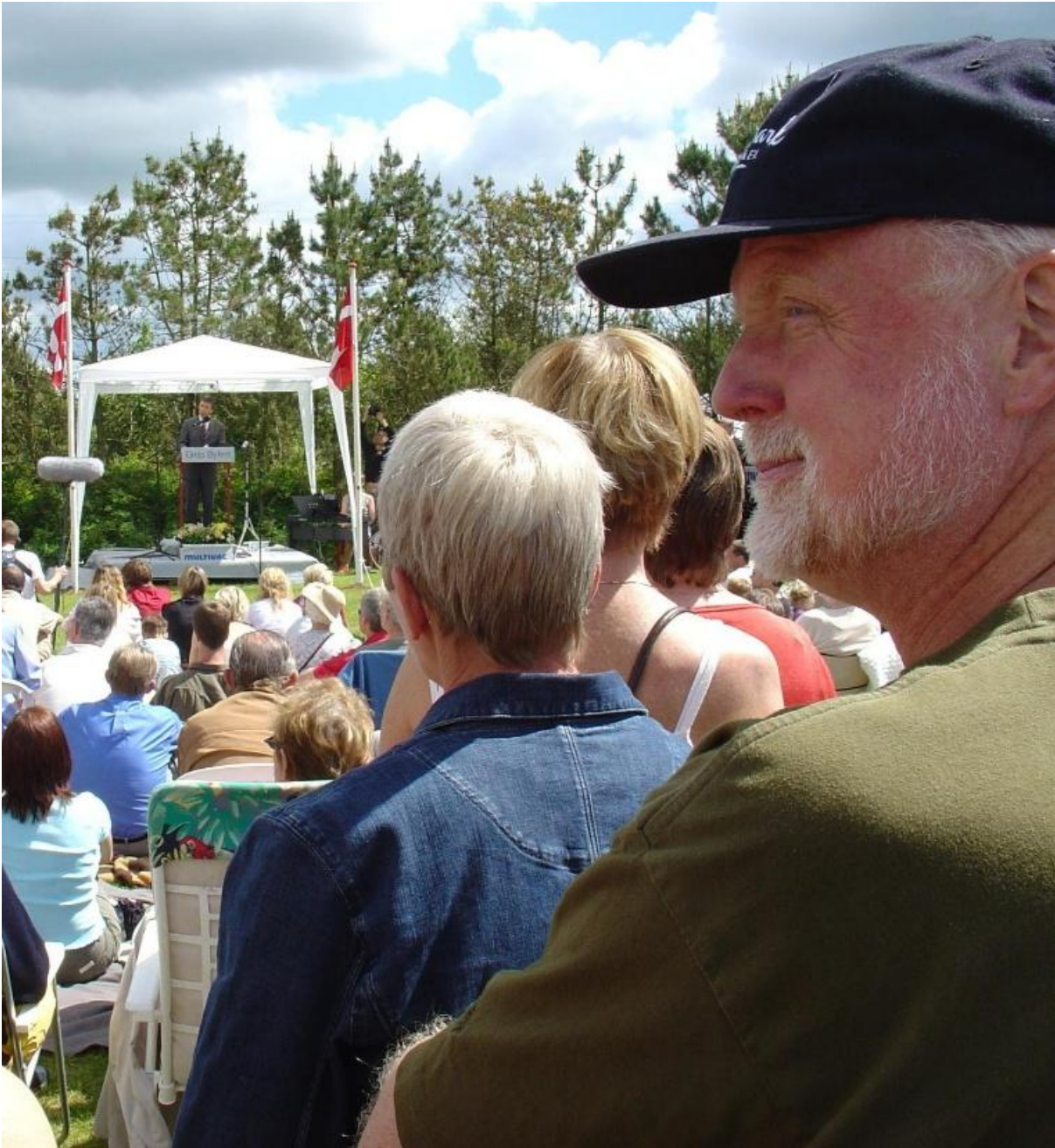
Figur 4 Glimt fra Byfesten Grundlovsdag med besøg og tale af Statsminister Anders Fogh Rasmussen.