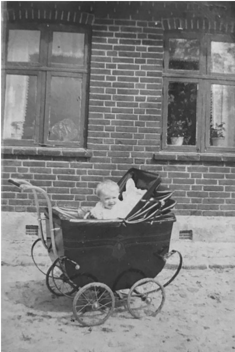
Inger i barnevogn udenfor Høgholt 1932