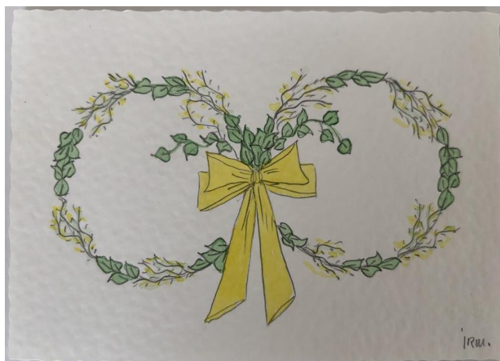
Akvarel af Inger Mikkelsen