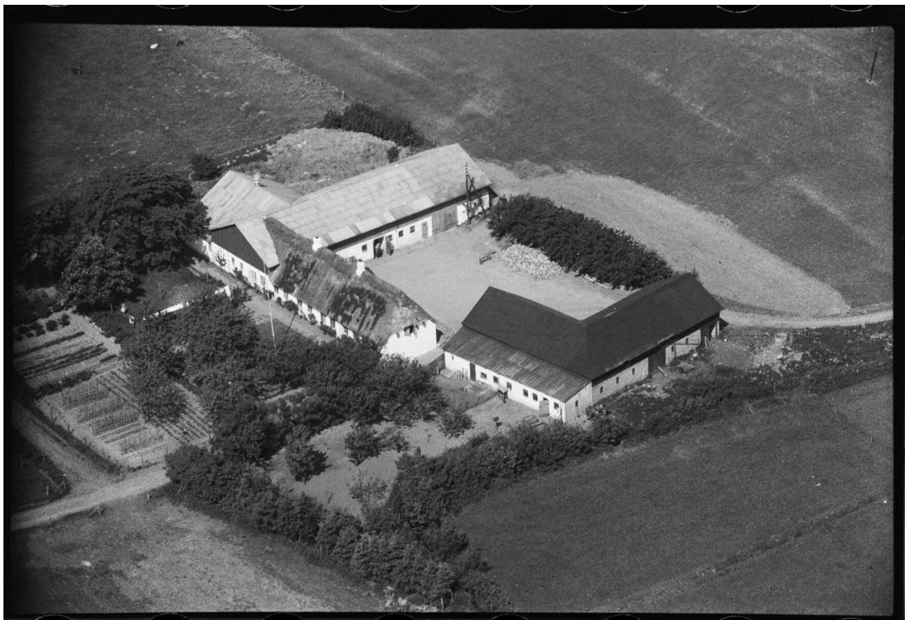
Signes fødehjem, Harbygård ved Løjt Kirkeby, Aabenraa. Luftfoto fra 1947.