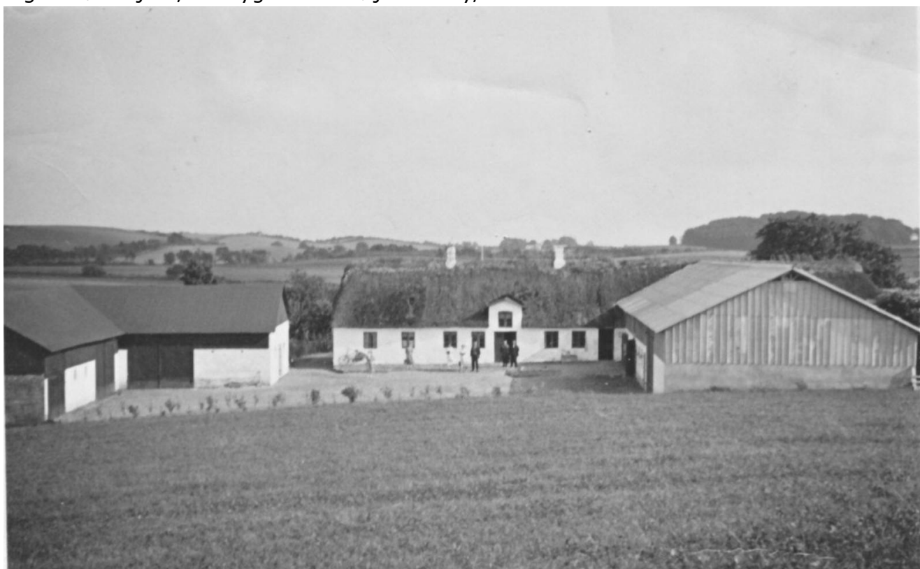
"Harbygaard", Brunbjergvej 120