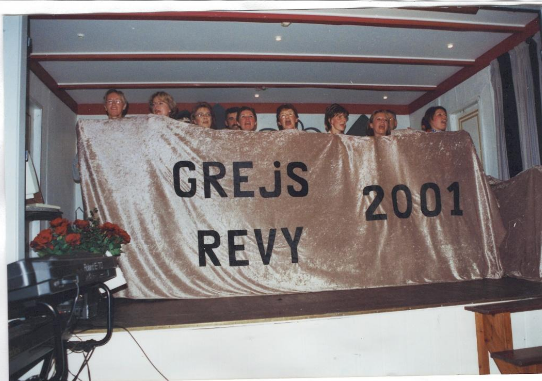
Billeder fra revy 2001 i Grejs Borgergård og sjove løjer i Grejs Byfest med udklædte mænd...