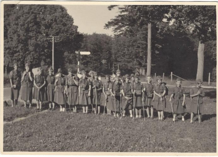
Spejderlejr på Bornholm med Habergaas trop