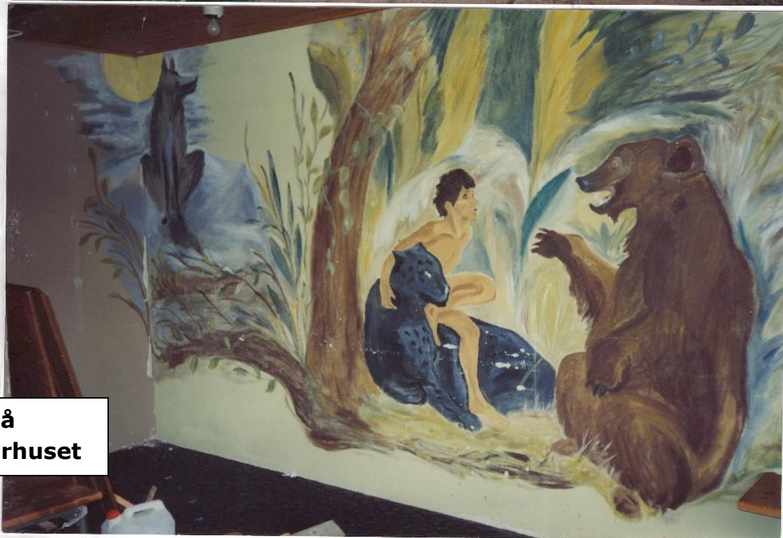
Signes malerier på væggene i spejderhuset

Jeg har altid holdt meget af spejderlivet, og da jeg selv Har altid holdt meget af spejderlivet, og da jeg selv har været KFUK spejder i Høbenroa og Løjt kom ideen til at starte en ulveskole i Grejs, fik også tjansen til at dekorere væggene i spejderhuset omkring 1980-1981.