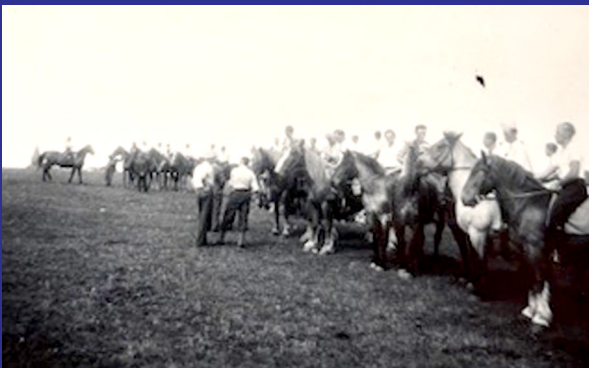
Samling af heste og deres ryttere på jordene bag Grejs - man kan svagt ane Grejs Kirke i baggrunden, længst til venstre i billedet. Måske gøres der klar til ringridning.

Vesterbygård har været en hjørnesten i Grejs' udvikling fra landbrugssamfund til, hvad byen er i dag. Dengang var 85 køer virkelig stordrift – det kan man ikke mere leve af som landmand.