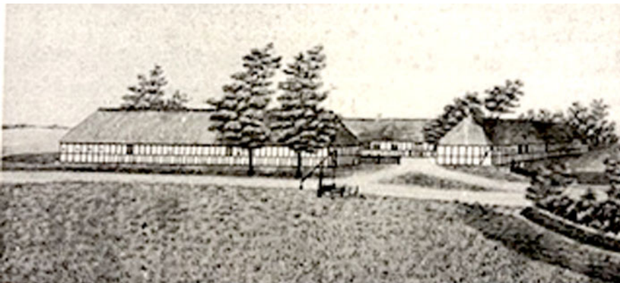
Grejs Præstegård, tegnet af C.J. Jespersen Ensted i 1877

Førhen var en præstegård både bolig for præsten, og havde også jorder og dyr tilknyttet, så præsten havde noget at leve af. Præsten kunne ikke selv drive gården, men havde en forpagter, piger og karle til at passe bedriften.