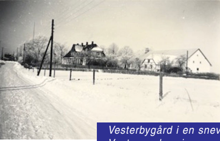
Vesterbygård i en snevinter, set fra Vestermarksvej.

En pinsetur i Vesterbygårds skov - med biler og traktor og arbejdsvogn. Vognen bruges som bord.